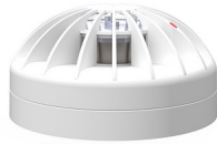
Этикетка БФЮК.425232.001-05 ЭТ