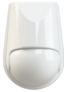
Этикетка БФЮК.425152.079-05 ЭТ